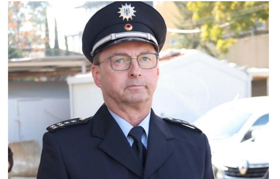
ضابط الارتباط في الشرطة الفيديريالية الالمانية يانس رورباخ.